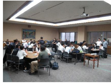
講演、話し合いの様子

講義の後、グループごとにネット利用の現状と対策について話し合い、ネット対策として「学校や家庭でルールを決める」や「スマホよりも楽しめることを探す（公園を増やす）」といった意見が出ました。