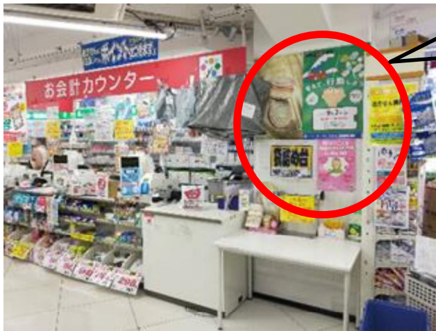
【常設の府政 PR コーナーの設置】

ドラッグストアアカカベや調剤薬局などの店舗内(レジスペース横、作荷台付近)に府政 PR コーナーを常設し、ポスター掲示やリーフレットの配架に協力します (取組みイメージ)