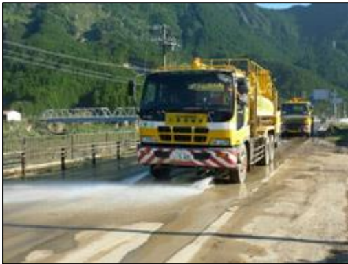
【災害時の復旧協力】