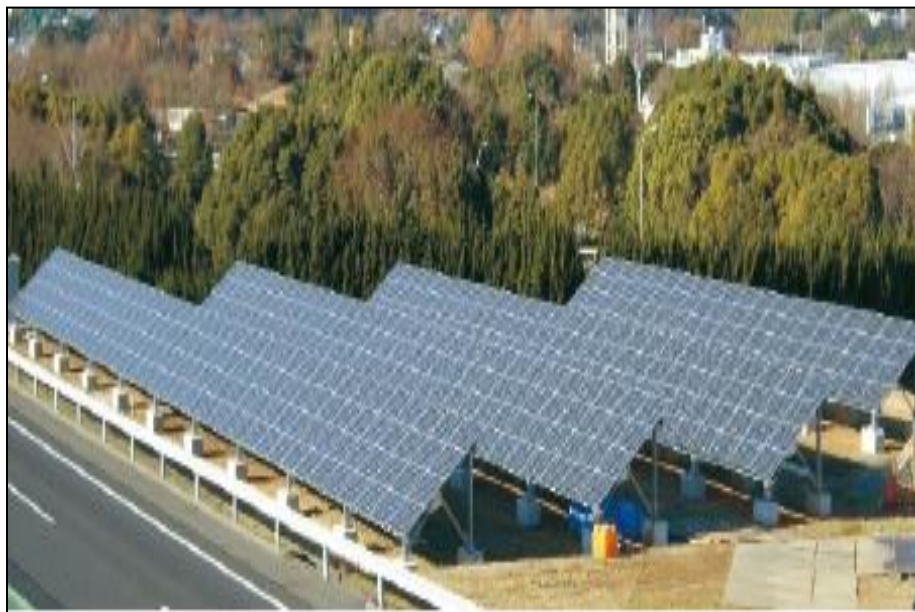
【太陽光発電などの設置】