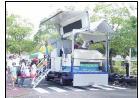
シートベルト効果体験(交通安全キャンペーン) 5