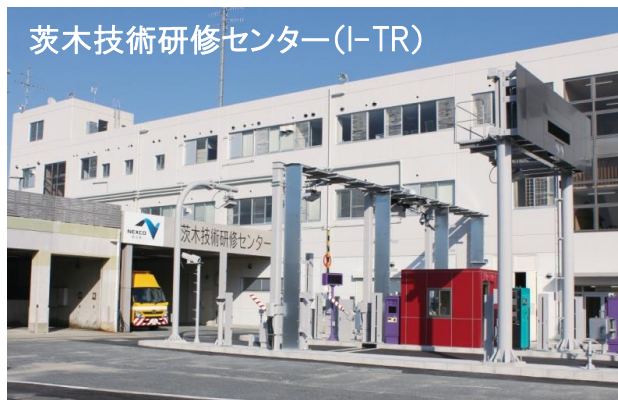
茨木技術研修センター(I-TR)