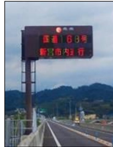
【一般道路情報の提供】