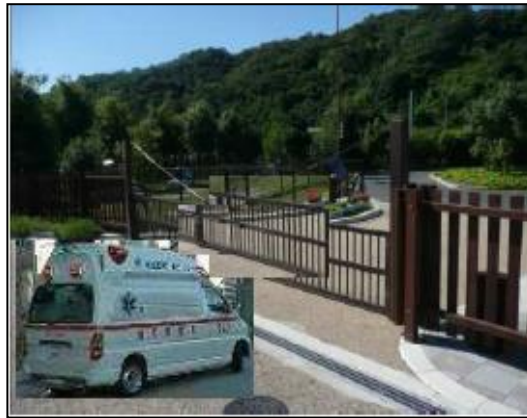
【緊急開口部の利用】