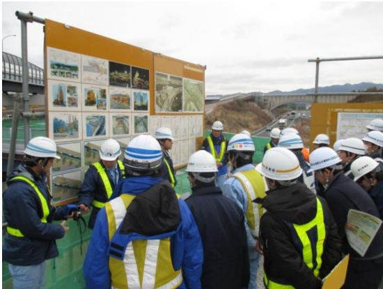
高速道路建設現場での技術講習会