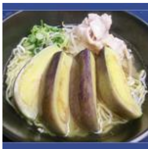
泉州水なすラーメン