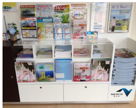
「情報カウンター」による地域情報リーフレットの無料設置