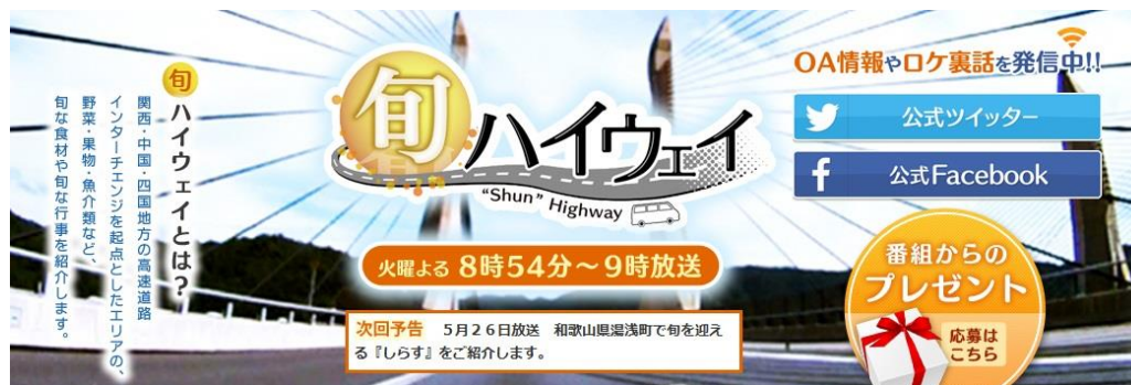
旬ハイウェイによる地域の旬な食材、旬な行事の紹介