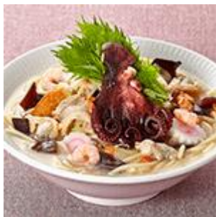
伝説のタコちゃんぽん 「泉だこ」を使用