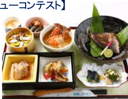
コンテスト参加メニュー「港・岸和田祭り膳」 大阪湾で獲れるチヌ・渡り蟹・たこなど 泉州名物を調理