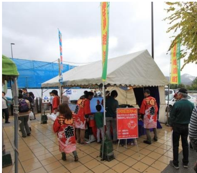
SA・PAでの観光PR・イベント等の実施