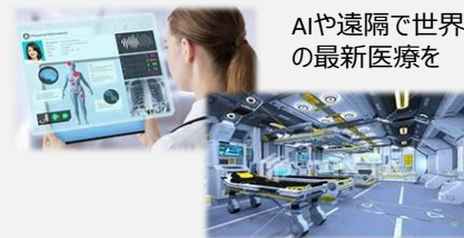
AIや遠隔で世界の最新医療を