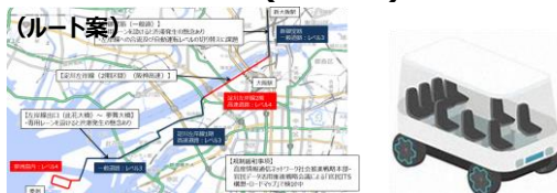
提供：2025年日本国際博覧会協会 ※電子地形図（国土地理院）を加工して作成