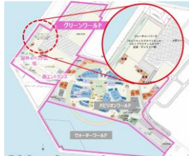
空飛ぶクルマの離着陸場