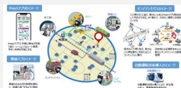
出典：Osaka Metro Group 中期経営計画「MaaSの推進」