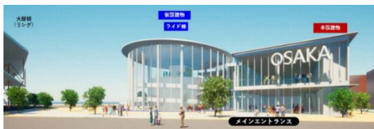
「大阪パビリオン」イメージ図