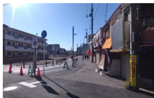
まちの防災性の向上例【整備後】