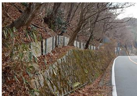
茨木能勢線（豊能町）【対策前】