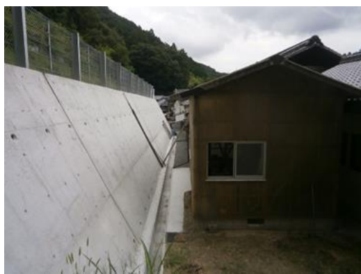
急傾斜崩壊対策事業（神ガ丘地区）