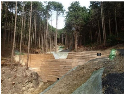
治山ダム（熊取町野田地区）