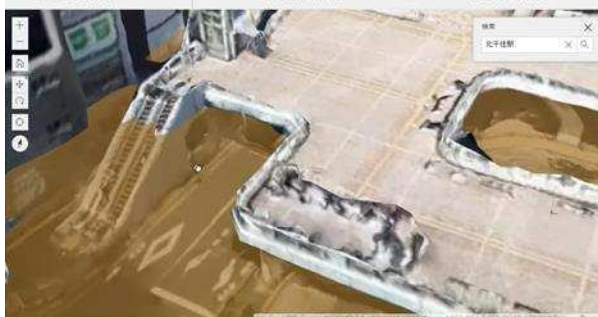
3D ハザードマップの例：荒川（国管理河川）