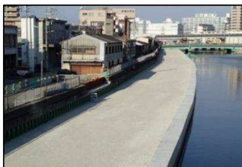
一級河川 六軒家川 防潮堤補強【対策後】