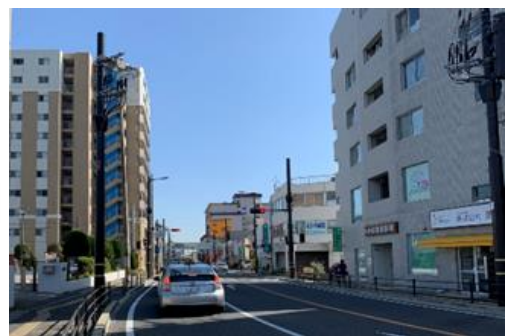
国道 176 号無電柱化【対策後】