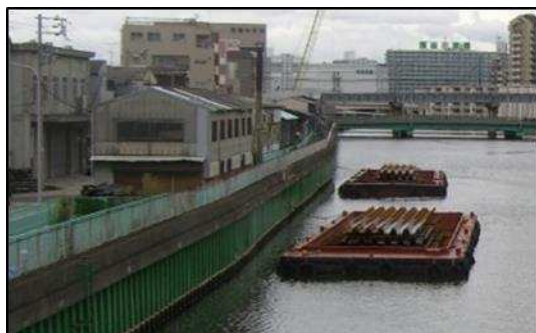
一級河川 六軒家川 防潮堤補強【対策前】