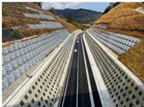
道路ネットワークの整備（主要地方道茨木摂津線）