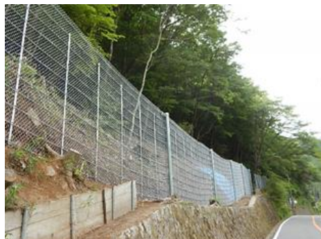
茨木能勢線（豊能町）【対策後】