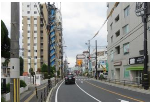
国道 176 号無電柱化【対策前】

○無電柱化を推進 1.2km 推進、うち 1.0km 完了 (20.6/21.4km 完了)