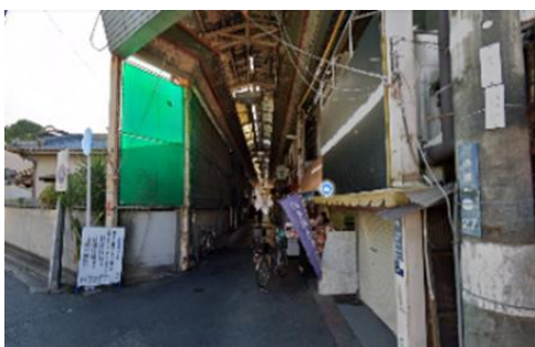
まちの防災性の向上例【整備前】