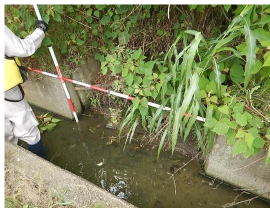
耐震診断のための現地調査の様子