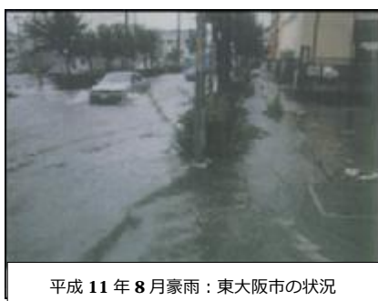
平成 11 年 8 月豪雨：東大阪市の状況