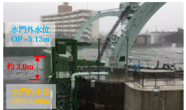
高潮対応の状況（木津川水門）

暴風、高潮及び波浪等により、泉州地域などに大きな被害を及ぼした。暴風は関西空港で最大瞬間風速 58.1 メートル、最大風速 46.5 メートルを、熊取で最大瞬間風速 51.2 メートル、最大風速 26.8 メートルを観測し、観測史上 1 位の記録を更新した。潮位は大阪検潮所（大阪市港区）で 329 センチメートルを観測し、過去の最高潮位を超える値を観測した。