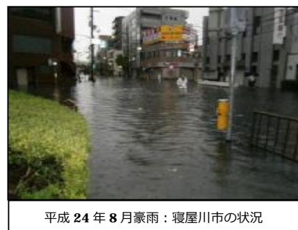
平成 24 年 8 月豪雨：寝屋川市の状況