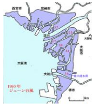
ジェーン台風による浸水区域