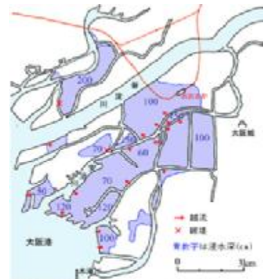
第 2 室戸台風による浸水区域