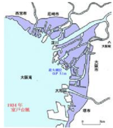
室戸台風による浸水区域

このほか、沿岸各地域にも浸水したところが多く、暴風と波浪によって泉州海岸一帯は防潮堤をはじめ公共土木施設等に甚大な被害を蒙った。