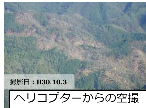
ヘリコプターからの空撮