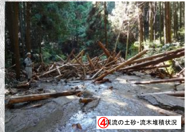
④ 溪流の土砂・流木堆積状況