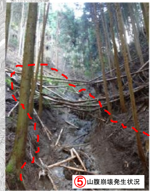
⑤ 山腹崩壊発生状況