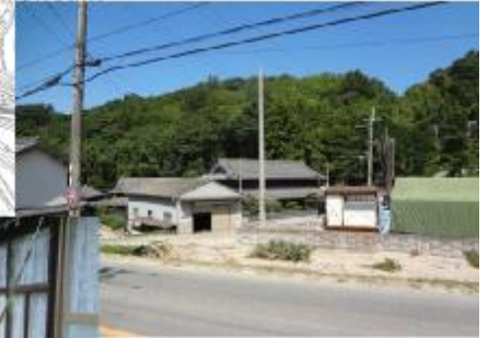
③ 下流の家屋の被災状況