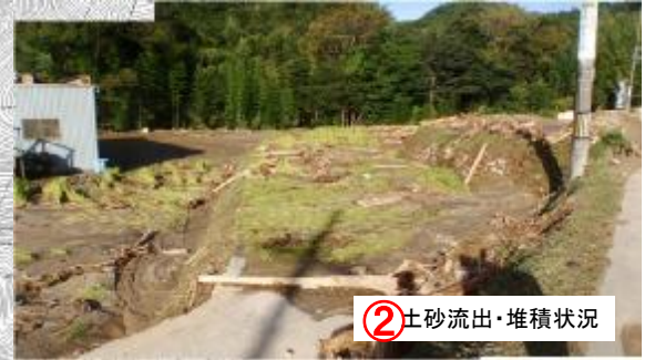
② 土砂流出・堆積状況