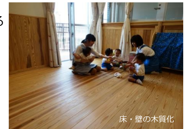
【一園一室木のぬくもり推進モデル事業 実施状況】