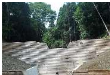
茨木市泉原地区 (R4年度竣工)