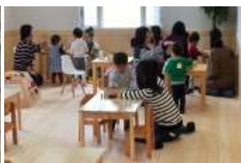
幼稚園の内装木質化