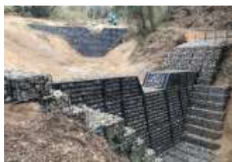
大東市寺川地区 (H30年度竣工)