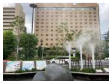
京阪・守口市駅 (R3年度竣工)