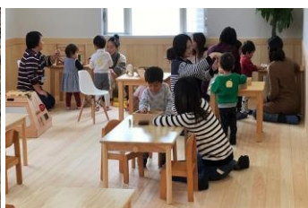
幼稚園の内装木質化