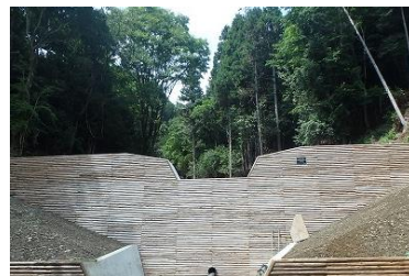
茨木市泉原地区 (R4年度竣工)