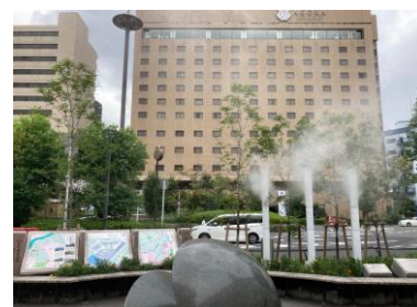
京阪・守口市駅 (R3年度竣工)