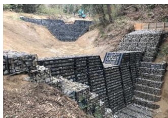
大東市寺川地区 (H30年度竣工)