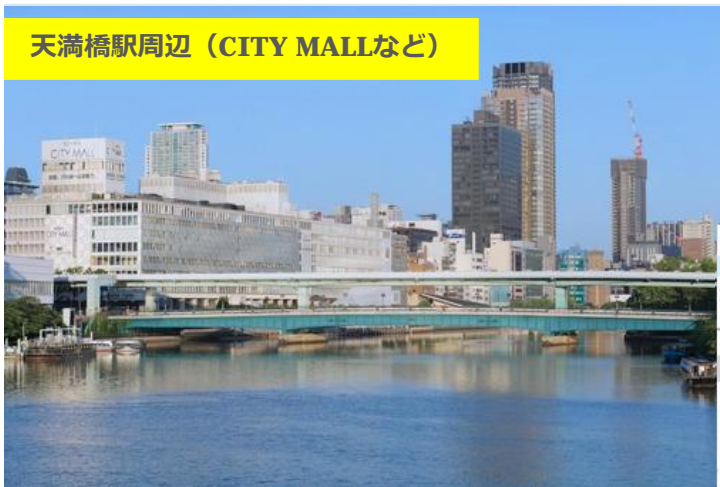
天満橋駅周辺 (CITY MALLなど)