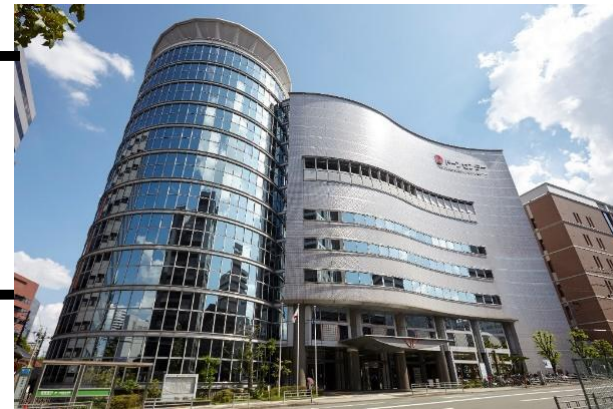
大阪府立男女共同参画・青少年センター (ドーンセンター)