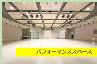
パフォーマンススペース