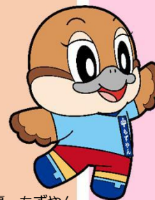
大阪府広報担当副知事 もずやん