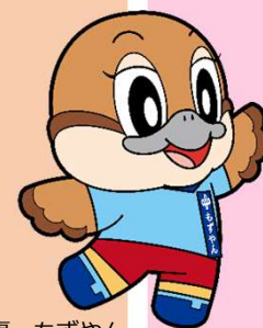
大阪府広報担当副知事 もずやん