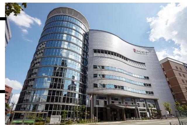
大阪府立男女共同参画・青少年センター (ドーンセンター)