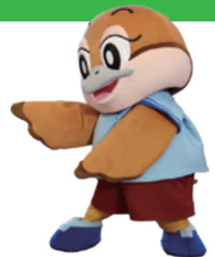
大阪府広報担当副知事 もずやん

大阪府では、再生可能エネルギー電気を府民みなんでおトくに購入する共同購入の参加者を募集します。日々の生活に使う電気を太陽光や風力などで発電したカーボンフリーの再生可能エネルギー電気に切り替えることができます。電気の使用量が増えるこの季節に、おトくにエコな電気に切り替えませんか？