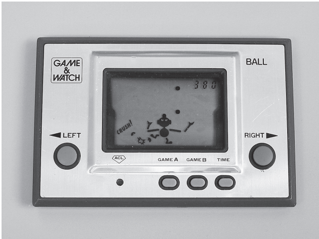
図3：ゲーム&ウォッチ 9 「BALL」

える「ゲーム&ウォッチ」を開発、1,000万台を超える大ヒットを生み出しました。(図3)