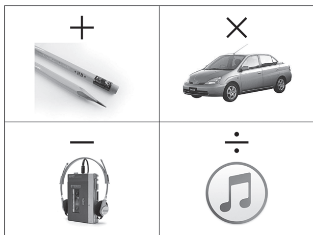
図1：加減乗除（四則演算）発想法例

ネットから一曲ずつダウンロードできるようにした音楽配信サービスは、音楽業界に破壊的なイノベーションをもたらしました。