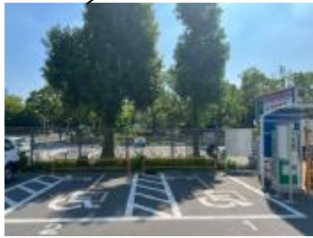
有料駐車場【大阪城前】 (2区画)