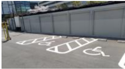
有料駐車場【本館西側】 (2区画)