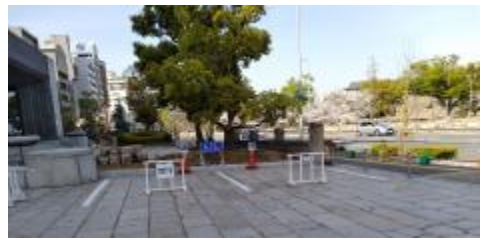
指定駐車場（本館東側）2区画