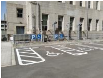
指定駐車場（本館西側）2区画