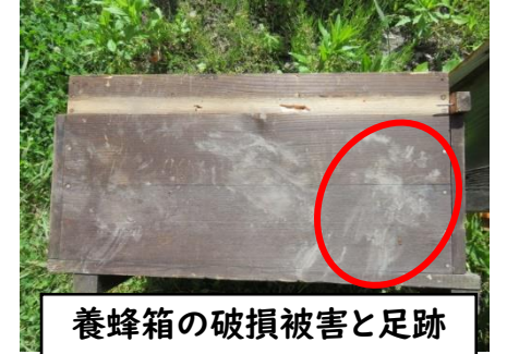
養蜂箱の破損被害と足跡