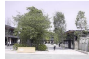
民活による新たな施設整備等による魅力向上

→府市がこれまで蓄積してきた技術的ノウハウと民間活力導入ノウハウを連携させ、公園緑地の整備・管理運営に最大限活用し、緑の環境を活かした様々な施設の導入やイベントの実施などにより、その収益等を還元しながら、安全・安心な公園緑地の更なる魅力向上につなげていく 【取り組み例】