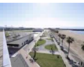
いこい・賑わい拠点 りんく公園エリア