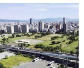
歴史文化観光拠点 難波宮跡公園