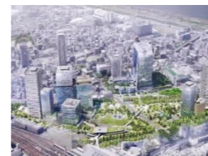
新たなまちの中心となるうめきた2期公園

→都市や地域の顔となる公園緑地において、質の高い空間の維持・創出を促し、まちづくりの中での効果的な活用や景観形成の観点をもって、まちの活性化や魅力向上に資する公園緑地整備を推進する 【取り組み例】