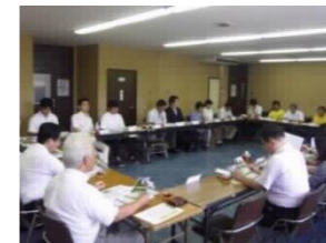
住民・企業等と連携したプラットフォームの設置

→府域の多様な公園緑地の連携を強化するとともに、公園緑地に係わる各種活動団体・企業などとのプラットフォームの設置などにより、相互に協力した情報発信やイベントなどを実施し、生活の質を高める楽しみ方の選択肢を広げていく 【取り組み例】