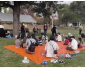
新たな公園の利活用の取組を市から府域全域へ展開