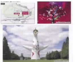
花やイベントなどの情報を府市共通HPなどで発信