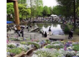
緑を活かした公園の魅力を高めるイベントの実施