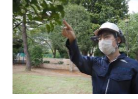
スマートグラスによる業務効率化の検証