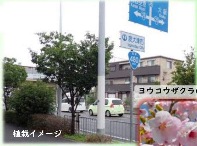
ヨウコウザクラの花