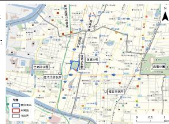
周辺見取り図 ベース図：NTT空間情報㈱