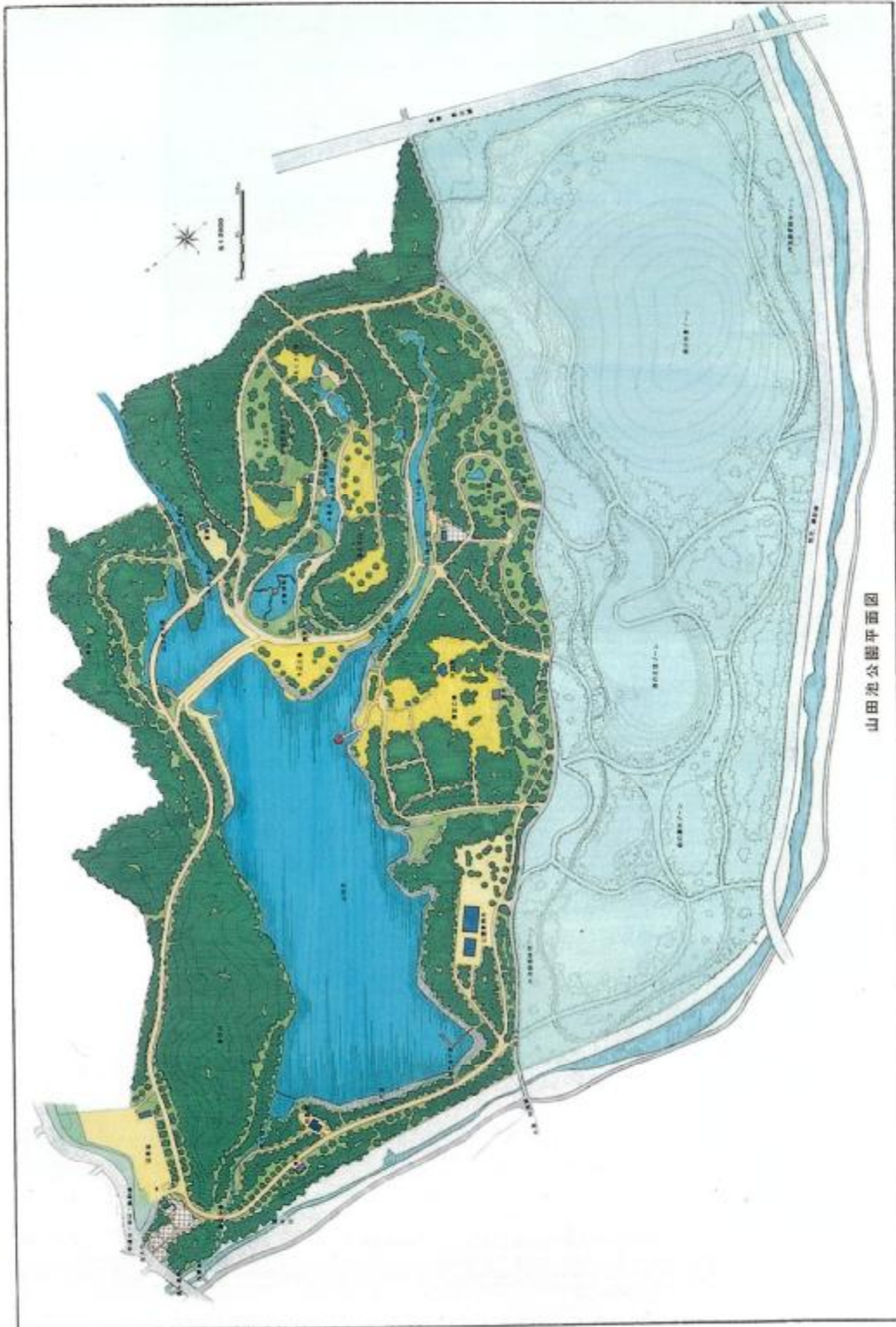
山田池公園平面図