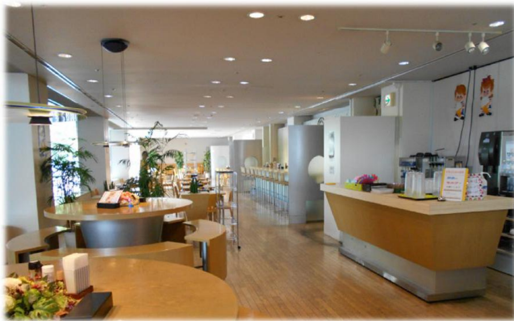
大阪府立門真スポーツセンター 厨房機器等 写真集