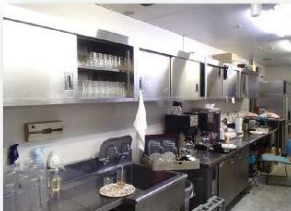
グラス棚、 シンク付サービス台