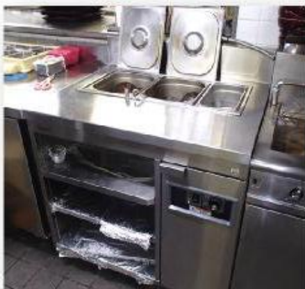
ウォーターテーブル