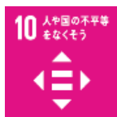
人や国の不平等をなくそう

SDGs の観点からも、幅広い分野にかかわり、波及効果も大きいスポーツには、府民や企業の行動を変えていく社会的役割が期待される。