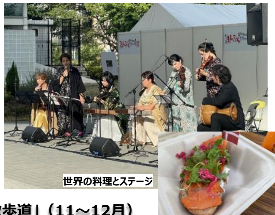
世界の料理とステージ