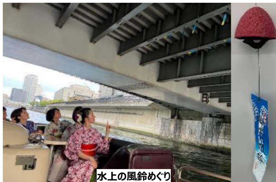
水上の風鈴めぐり

水辺のSDGsスクール(夏休みの小学生を対象に、水都の暮らしと文化・川の生き物・ごみについて学ぶ取り組み)【72名参加】