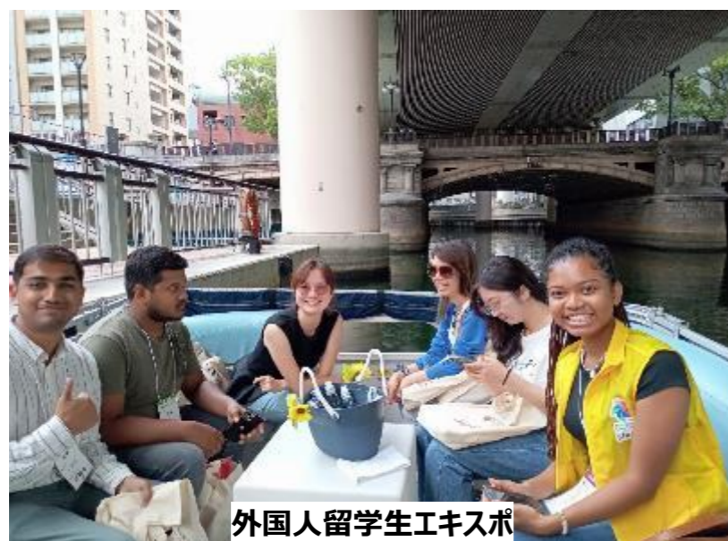
外国人留学生エキスポ