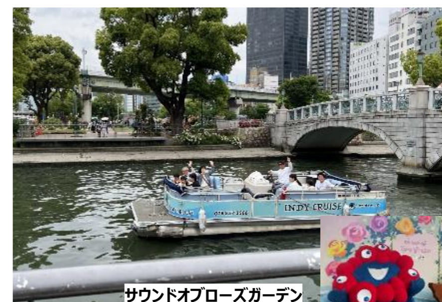
サウンドオブローズガーデン