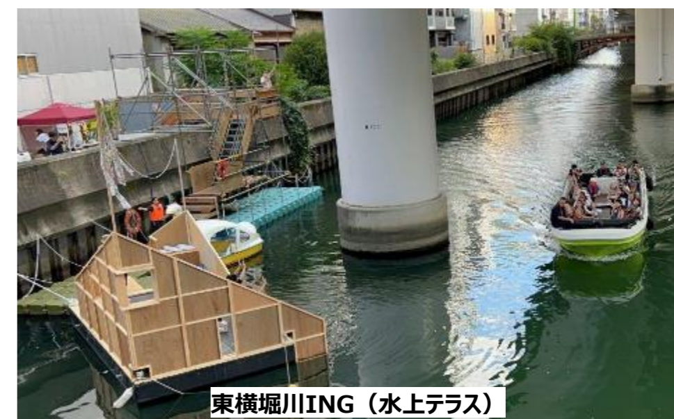
東横堀川ING（水上テラス）