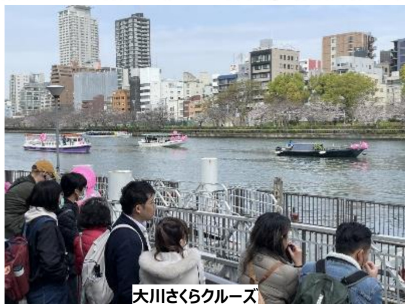
大川さくらクルーズ