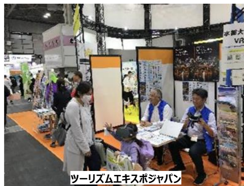
ツーリズムエキスポジャパン