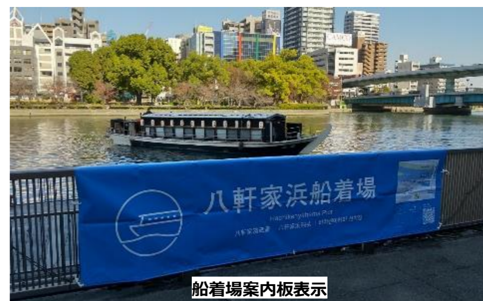
船着場案内板表示