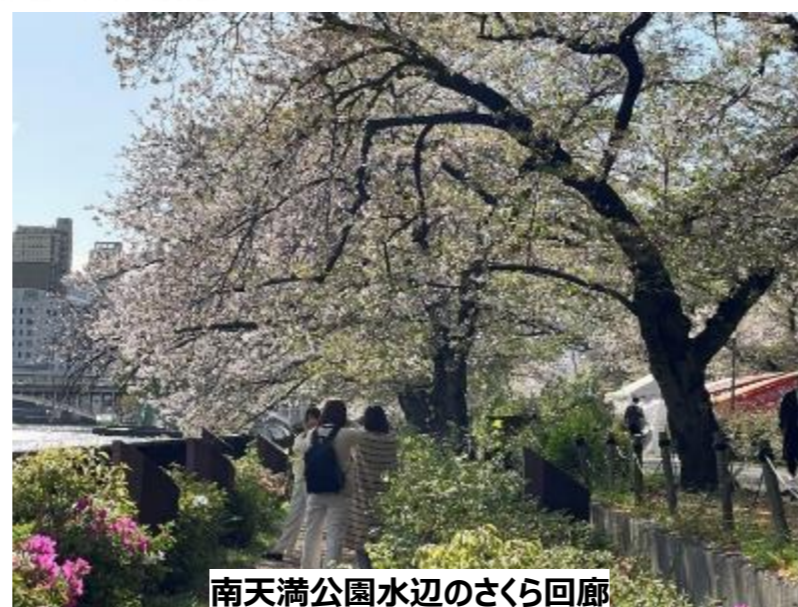
南天満公園水辺のさくら回廊