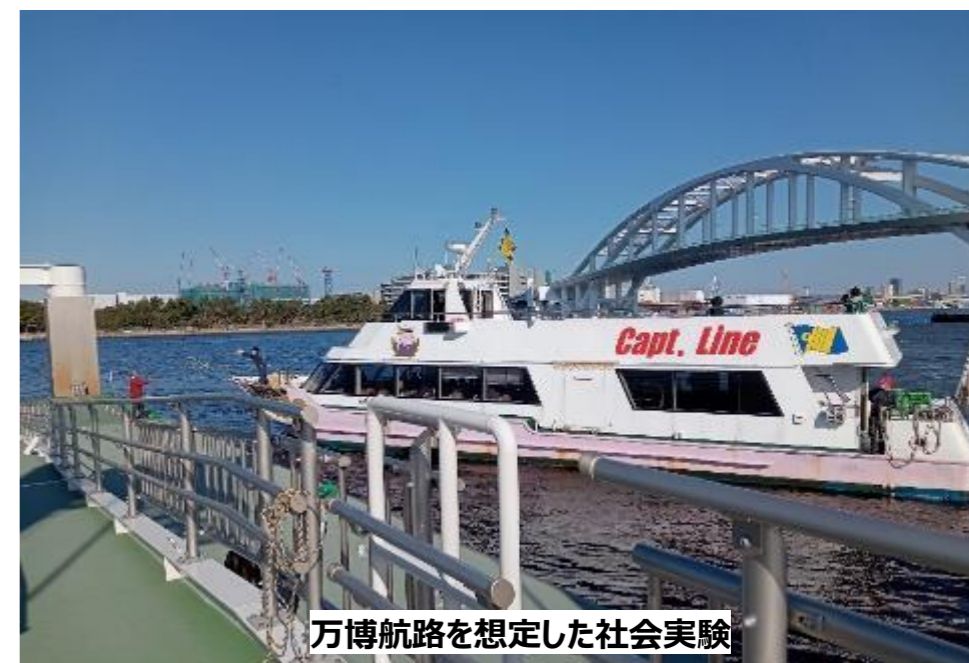
万博航路を想定した社会実験