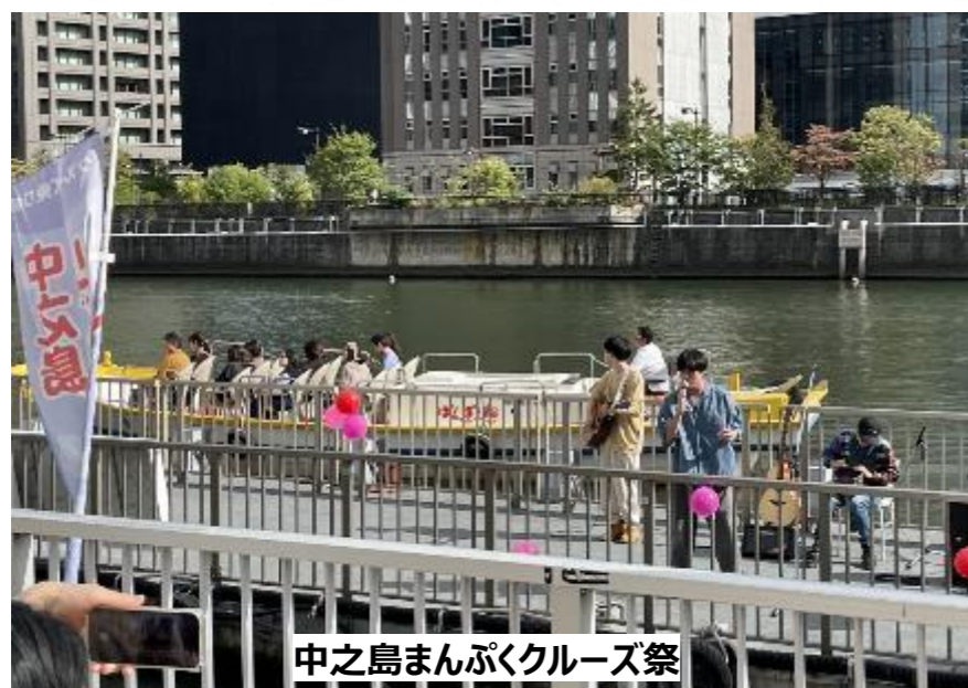
中之島まんぷくクルーズ祭

※キタハマミズム船寄場社会実験、近畿大学による企画(水都大阪アカデミア事業)と連携