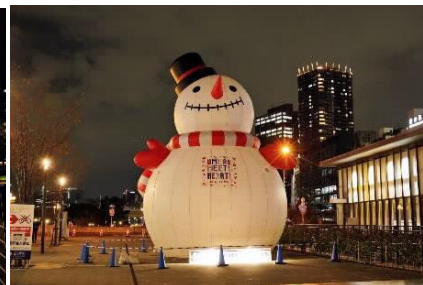
BIGスノーマンin中之島