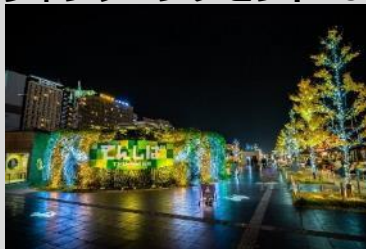
Welcoming アベノ・天王寺キャンペーン事務局