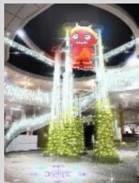
いばらきイルミフェスタ実行委員会