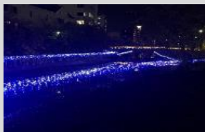
堺環濠イルミネーション連絡会