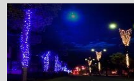
木楽座ストリート組合