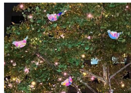
みんなの夢ツリー