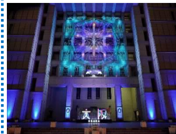
大阪市役所正面イルミネーション ファサードとフォトモニュメント