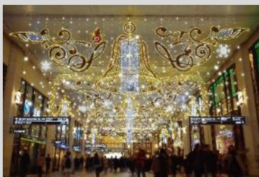
UMEDA MEETS HEART実行委員会