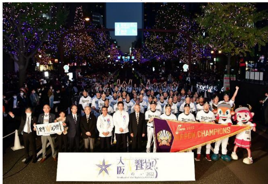
フォトセッション