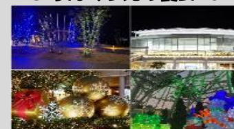
りんくうまちづくり協議会