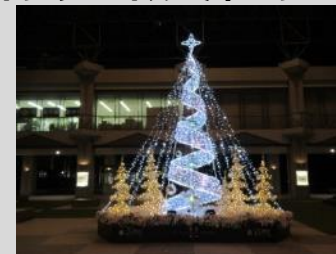
大阪ベイトワー ウィンターイルミネーション 2022 委員会