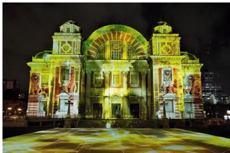
大阪市中央公会堂壁面プロジェクションマッピング

20年目を迎えるOSAKA光のルネサンスは、水都大阪のシンボル中之島に広がる水辺の風景を活かした光のプログラムを展開。3年ぶりに大阪中央公会堂壁面プロジェクションマッピングや光のマルシェを実施したほか、台南政府観光旅游局「光・彩り台南」やUMEDA MEETS HEART2022「BIGスノーマンin中之島」、高知光のフェスタ「高知城植物図鑑」など、地域等と連携したコンテンツを実施。