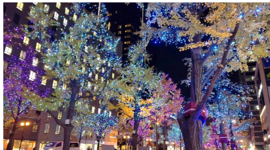
ブルーアソートミックス

初の試みとして、音楽と光りが連動する“Light show 2022”を開催。 また、御堂筋近隣の小学生が未来への想いを書いた「鳩」の モティーフを取り付けた「みんなの夢ツリー」を設置。 子どもたちの想いがイルミネーションと一緒に輝きました。