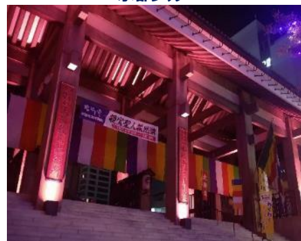
ビルファザードライトアップ