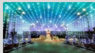
大東市イルミネーションイベント実行委員会