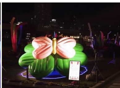
大阪芸術大学 学生作品 未来へはばたく光のカーニバル