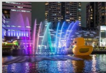
中之島ウエスト・エリアプロモーション連絡会