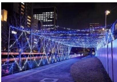
リバーサイドイルミネーション