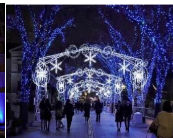
中之島イルミネーションストリート