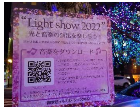
Light show 2022