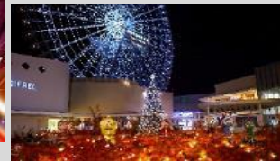
万博記念公園マネジメント・パートナーズ ×EXPOCITY