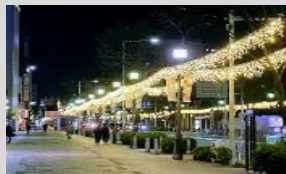
堺市中心市街地活性化協議会