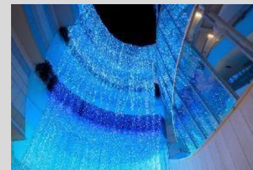
Mプロジェクト実行委員会