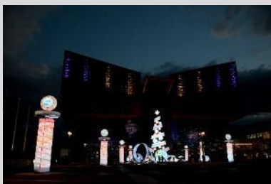
築港・天保山ウィンターイルミネーション実行委員会