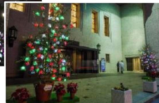
中之島ウエストエリアと連携 ひかりの美