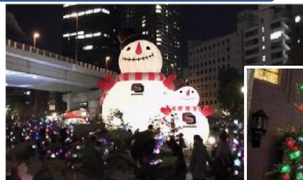
梅田エリアと連携 スノーマンパーク in 中之島