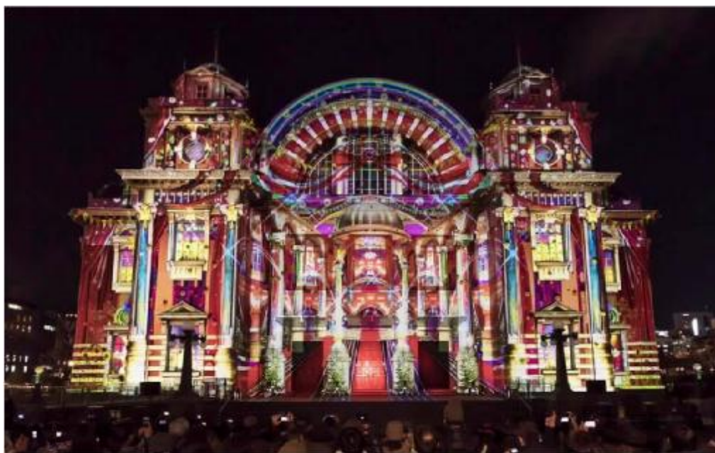
ウォールタペストリー・大阪中央公会堂開館100周年記念公演～百年の輝き～

OSAKA光のルネサンスは今年で開催16年目 さまざまな主体との連携を推進している