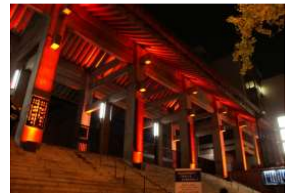
沿道ビル等のライトアップ