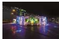
Welcomingあべてんウインタープレゼント♪ 主催：Welcomingアベ・天王寺キャンペーン事務局