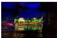
光のプレミアムボート 主催：大阪シティクルーズ推進協議会