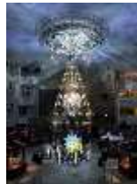
街中がスノーマン！/光のヒンメリ 主催：梅田スノーマンフェスティバル2016実行委員会