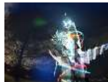
太陽の塔3Dプロジェクションマッピング 主催：大阪府日本万国博覧会記念公園事務所