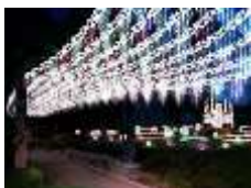
天満・桜ノ宮 光のエLEGANS 主催：天満エリア交流会