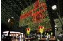
街中がスノーマン！/トワイライトファンタジー 主催：梅田スノーマンフェスティバル2016実行委員会