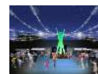
大東市スマイルミネーション2016 主催：大東市イルミネーションイベント実行委員会