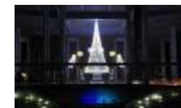
浪切ホールウインターイルミネーション 主催：港緑振興会