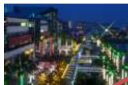
光の回廊（コリドー）クリスマスバージョン 主催：光のワンダーランド実行委員会