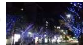
「堺東・大小路・堺駅」イルミネーション2016 主催：堺市中心市街地活性化協議会・大小路界限『夢』倶楽部