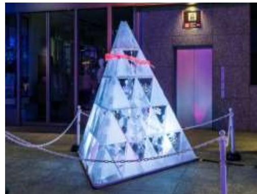
光のモニュメント