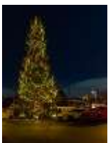
築港・天保山ベイエリアイルミネーション 主催：築港・天保山ウインターイルミネーション実行委員会