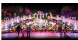
スーパーフラワー 主催：Mプロジェクト実行委員会