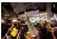
新梅田シティ・クリスマスツリー 主催：ドイツ・クリスマスマーケット大阪実行委員会