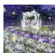
光の森 主催：長居公園スポーツの森プロジェクトグループ