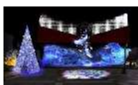
築港・天保山ベイエリアイルミネーション 主催：築港・天保山ウインターイルミネーション実行委員会