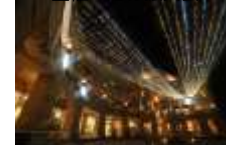
冬のペイサイドイルミネーション 主催：港緑振興会