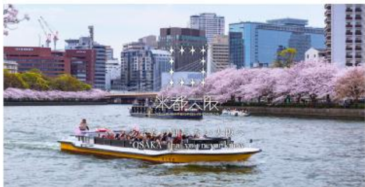
大川さくらクルーズ