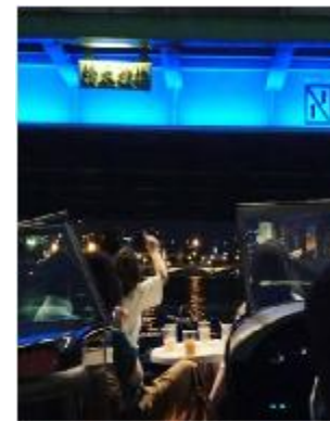
イベント連携・中之島周遊