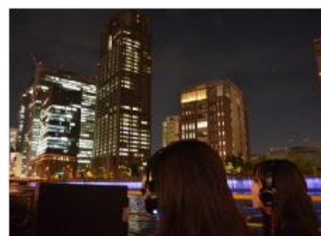
中之島リバークルーズ