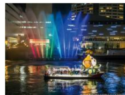
冬ものがたりシンボルシップ