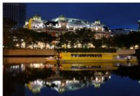
光の中之島クルーズ