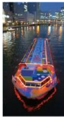
アート観光船ハタポップライナー