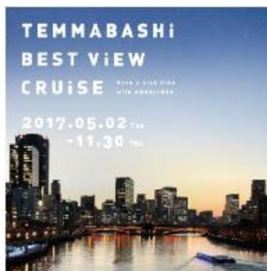
ベストビュー/ナイトビュークルーズ