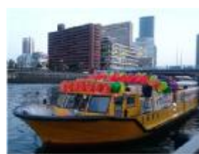
おりがみ パラアート船