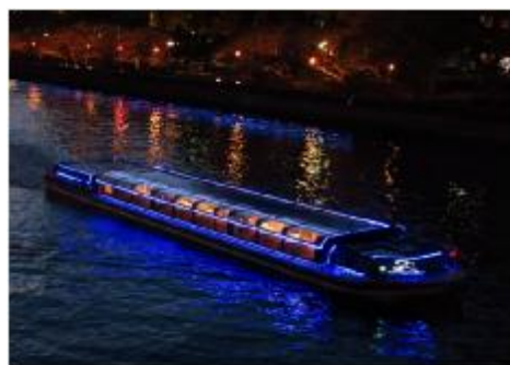
船上クリスマスショー&光クルージング