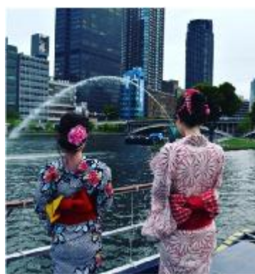
ひまわり納涼ゆかたクルーズ