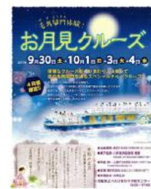
毛馬閘門体験お月見クルーズ