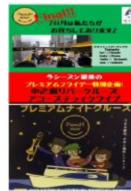
プレミアムフライデー