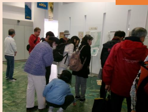
施設内の展示を見学しながら、台風や高潮、地震、津波について、そして、その対策の重要性について学びました。