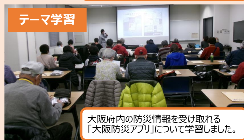
大阪府内の防災情報を受け取れる「大阪防災アプリ」について学習しました。