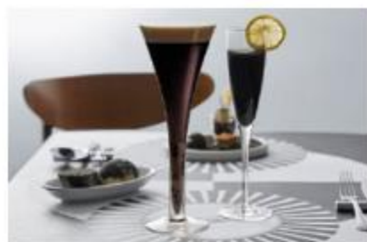
左：ブラックベルベット Black Velvet ～スパークリングワイン+黒ビール～ 右：チャコールレモネード Bamboo charcoal lemonade ～チャコール(竹炭)入りノン アルコールドリンク～