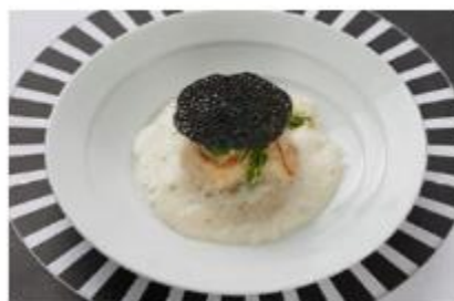
ホタテ貝柱と舌平目のシャンパーニュ風味 チーズ入りリゾットと和ハーブの香り