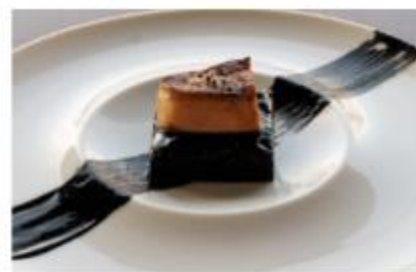
コシノジュンコ流お好み焼き フォアグラ添え