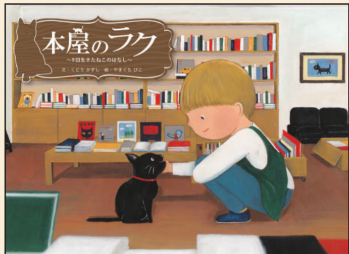
くどうかずし 先生 『本屋のラク ～9回生きたねこのはなし～』 文：くどうかずし 絵：やまぐちびこ 株式会社出版ワークス