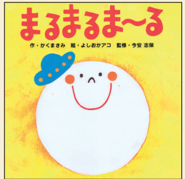
よしおかアコ 先生 『まるまるま〜る』 作：かくまさみ 絵：よしおかアコ 監修：今安志保 株式会社出版ワークス