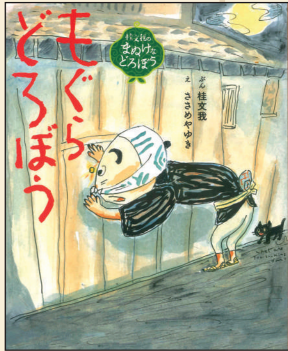
桂文我 先生 『桂文我のまめけなどろぼう もぐらどろぼう』 ぶん：桂文我 え：ささめやゆき BL出版株式会社