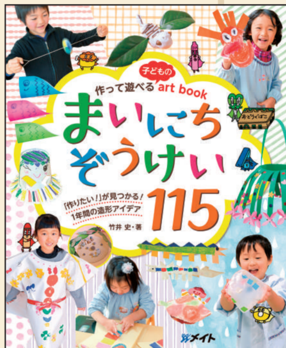
竹井史 先生 『作って遊べる子どもの art book まいにちぞうけい 115』 著：竹井史 株式会社メイト