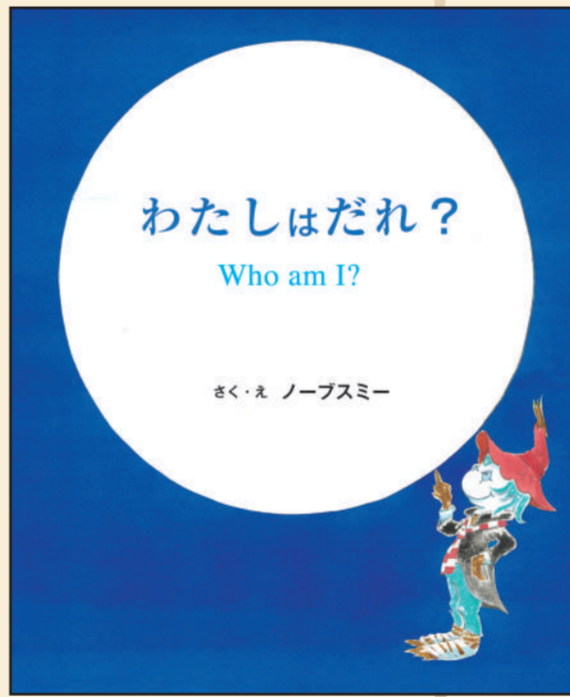
ノーブスミー 先生 『わたしはだれ？』 さく・え：ノーブスミー 株式会社出版ワークス