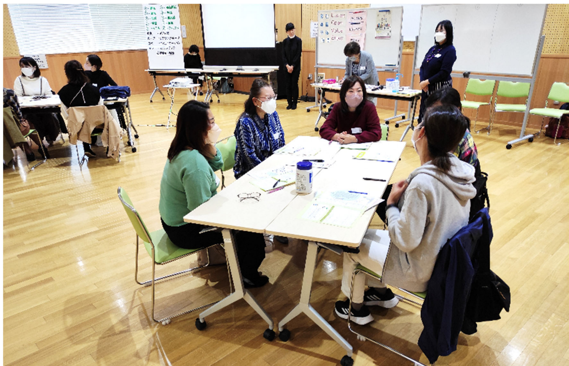
「ワイワイくらぶ」のメンバーによるスムーズなファシリテートのもと、日ごろの子育てについて話す参加者のみなさん