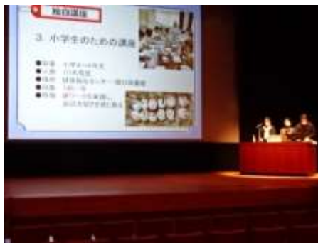
柏原市親まなびスマイル 親学習の実践報告