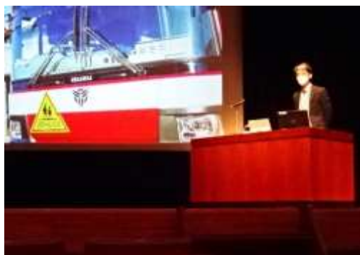
堺支援学校における特色 ある取組みや活動事例