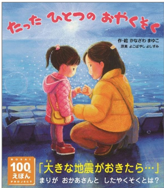
『たったひとつのおやくそく』 作・絵：かなざわまゆこ 原案：よこばやしよしずみ 神戸新聞総合出版センター