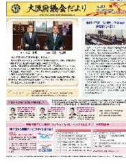
[令和 6 年 1 月号]