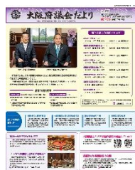
[令和 5 年 7 月号]