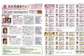
[令和 5 年 12 月号]