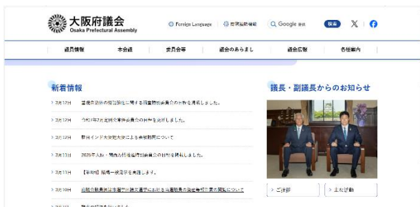
[大阪府議会ホームページ]