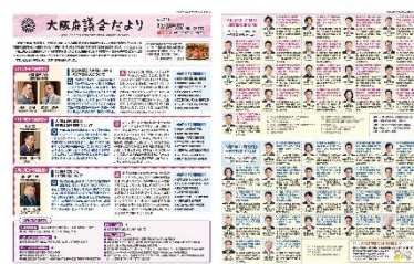
[令和 6 年 4 月号]