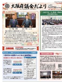
[令和 7 年 1 月号]