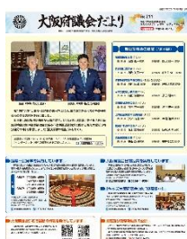
[令和 6 年 7 月号]