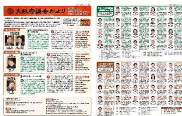
[令和 6 年 12 月号]