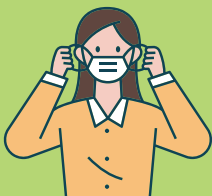
Porter un masque

Veillez à ce que votre toux et vos éternuements n'atteignent pas les personnes autour de vous.