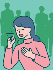
Détourner le regard