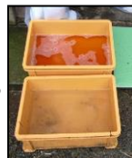
推奨される踏込消毒槽の設置方法！