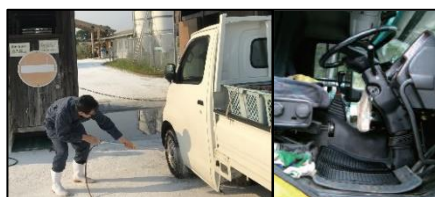
車両はタイヤだけでなく、 泥よけの内側まで消毒 し、 フロアマットの交換 や ペダル等車内も消毒