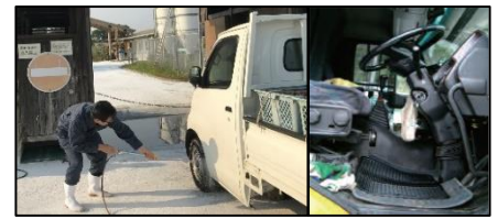
車両はタイヤだけでなく、 泥よけの内側まで消毒 し、 フロアマットの交換 や ペダル等車内も消毒