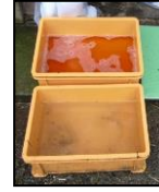
推奨される踏込消毒槽の設置方法！