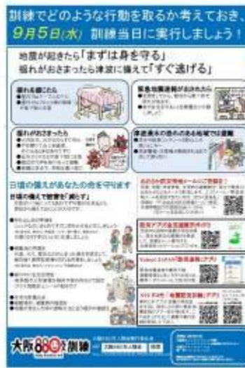
公式リーフレット（表面・裏面）