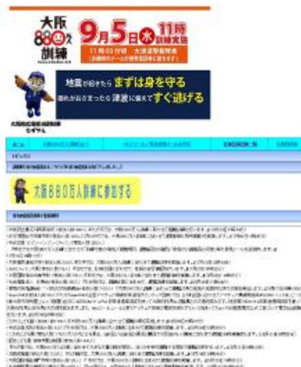
訓練登録団体の紹介 （ホームページトップ画面）