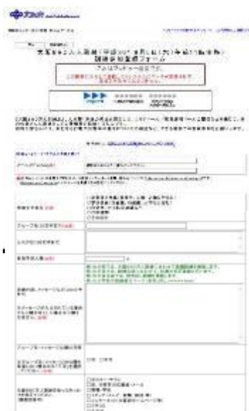
訓練事前参加登録フォームの画面

そのため、今回の訓練から、各団体などが実施する特色のある運動訓練を積極的に情報提供することで、地域や企業などでの取り組みがさらに広がりを見せるように訓練参加団体の登録制を開始し、ホームページで様々な訓練の取り組みを紹介した。