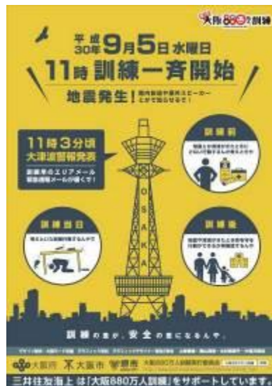
タイアップ ポスター・チラシ (製作：三井住友海上火災保険 株式会社) (デザイン：学校法人 日本教育財団 大阪モード学園)