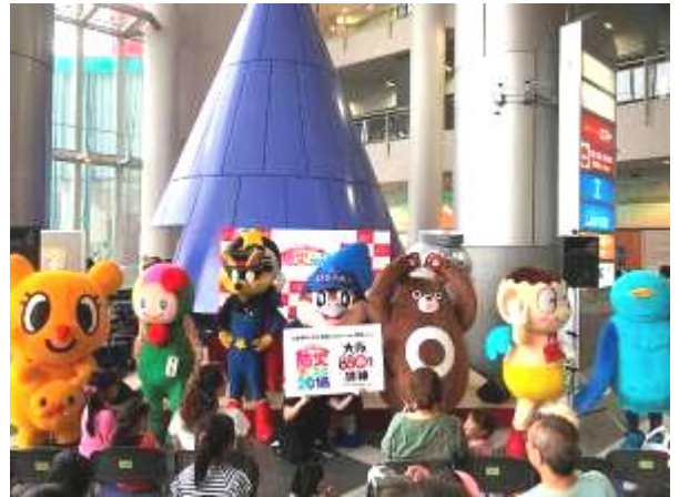
大阪南港 ATC 防災フェスタ 2018 親子体験型イベントでの告知 PR（9月2日） （関西ぱど、連携企業）