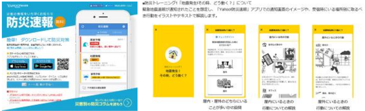
ヤフー防災アプリの新機能画面「訓練モード」

ヤフー株式会社が提供しているスマートフォン向け防災通知アプリ「Yahoo!防災速報」の新機能を活用して、災害時に取るべき行動についての知識を深めていただき、『大阪 880 万人訓練』で活用していただくよう取り組みを行った。なお、ヤフー防災アプリの新機能を活用して自治体と連動した訓練は全国で初めて。