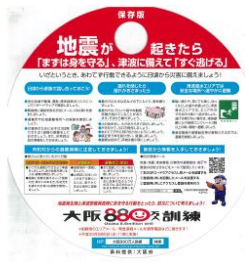
啓発うちわ (公益財団法人 日本公衆電話会)