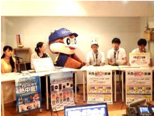
大阪府チャンネルでの告知 PR（8月2日）