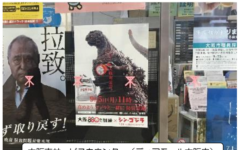
大阪市サービスカウンター (ディアモール大阪内)