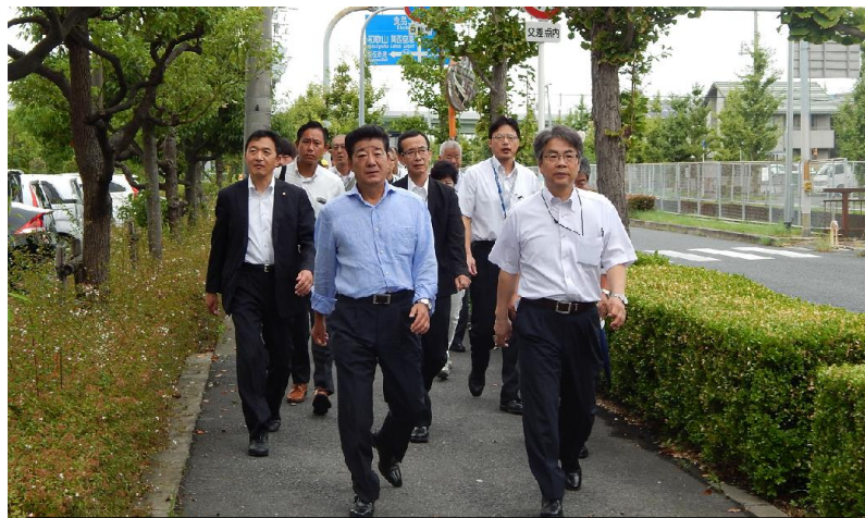
泉佐野食品コンビナート協会の皆さまと避難する松井知事