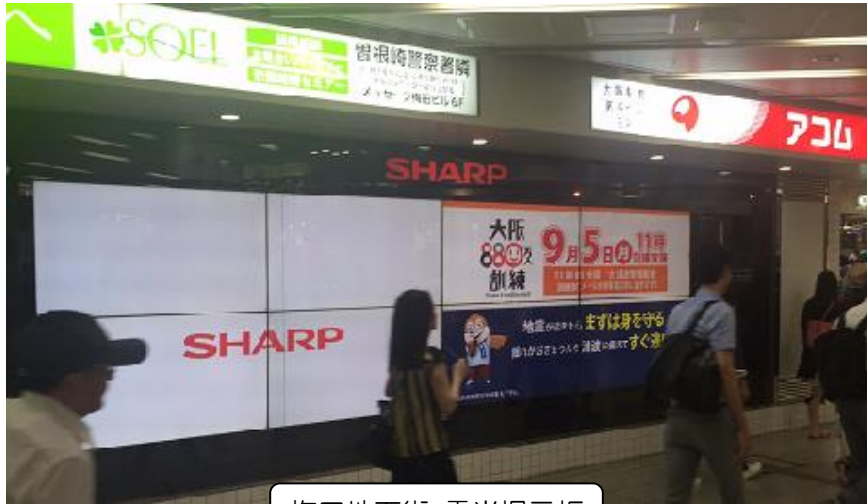
梅田地下街 電光掲示板