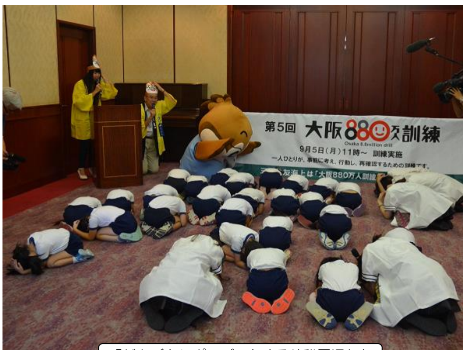
「だんごむしポーズ」をする幼稚園児たち