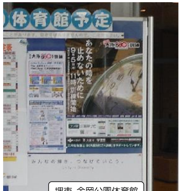
堺市 金岡公園体育館