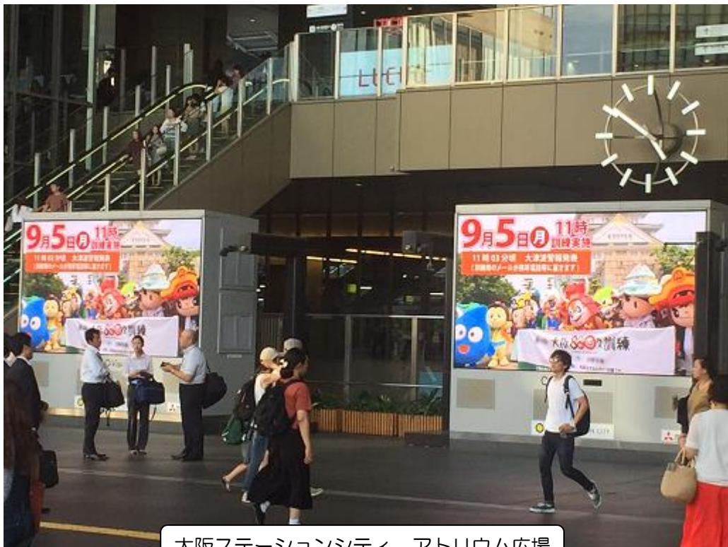
大阪ステーションシティ アトリウム広場