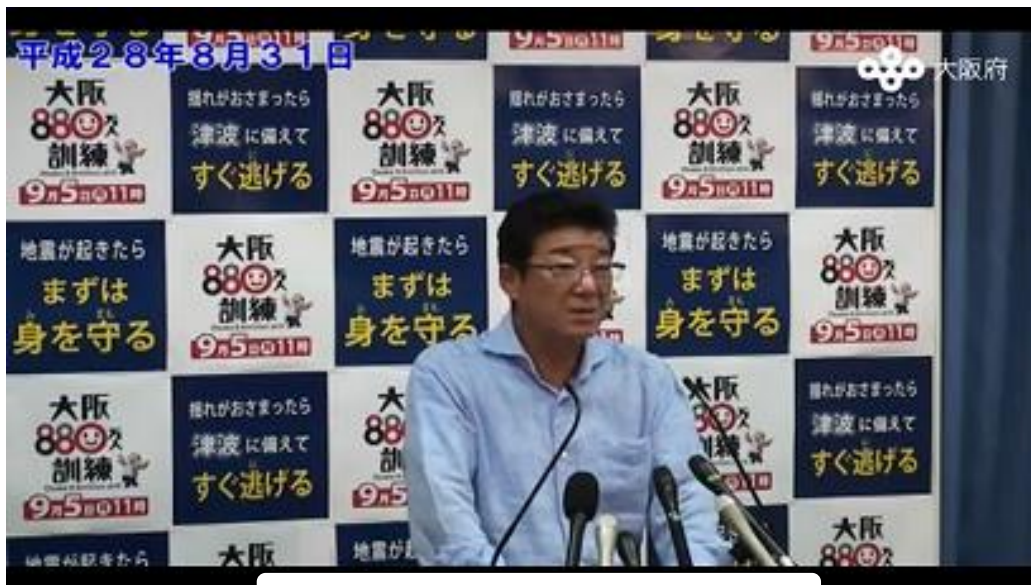
平成 28 年 8 月 31 日 知事記者会見