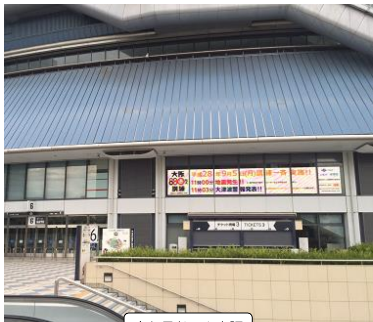
京セラドーム大阪