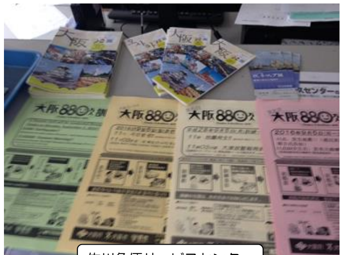
佐川急便サービスセンター