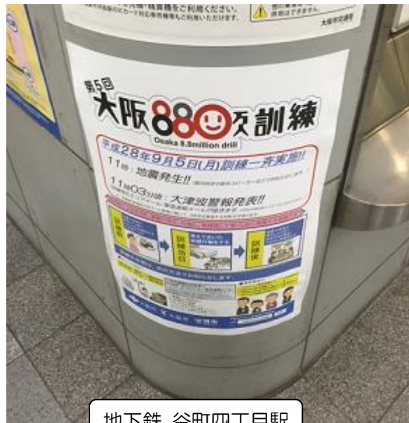
地下鉄 谷町四丁目駅