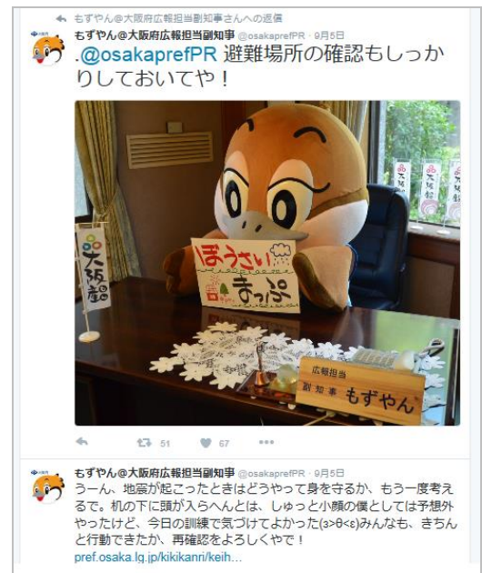
大阪府広報担当副知事もずやん twitter