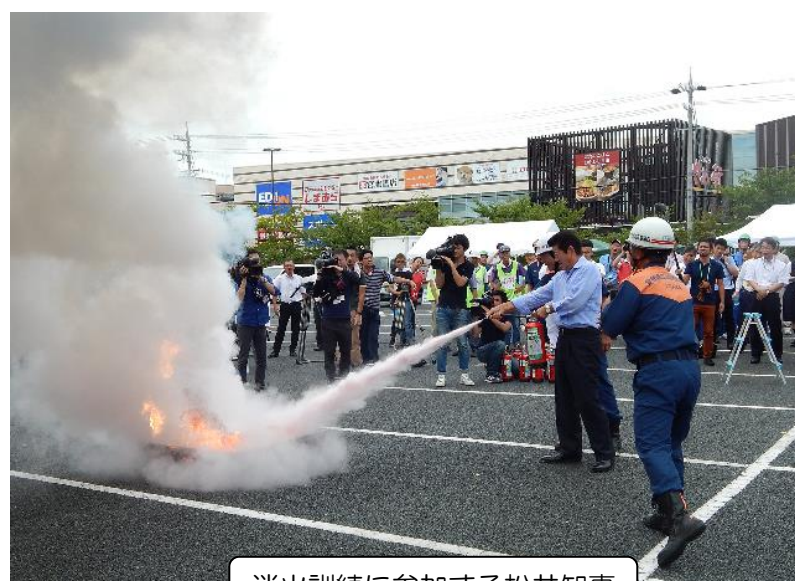
消火訓練に参加する松井知事