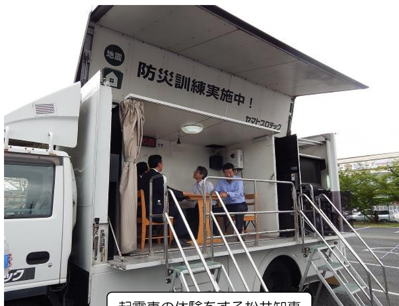
起震車の体験をする松井知事