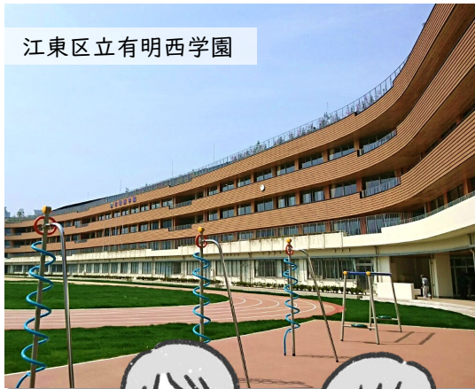
江東区立有明西学園