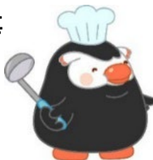
「エリカちゃん」のお友達の「エリマルくん」