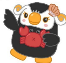
「エリカちゃん」のお友達の「エリナちゃん」

北方領土隣接地域※を訪問 する修学旅行を検討いただく ための、先生方を対象とした 下見ツアーです。