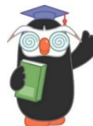
「エリカちゃん」のお友達の 「エリヨシくん」