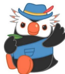
「エリカちゃん」のお友達の「エリオくん」