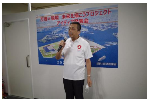
博覧会協会・森副事務総長コメント (作成したての万博ロゴ入りポロシャツを お披露目いただきました。)