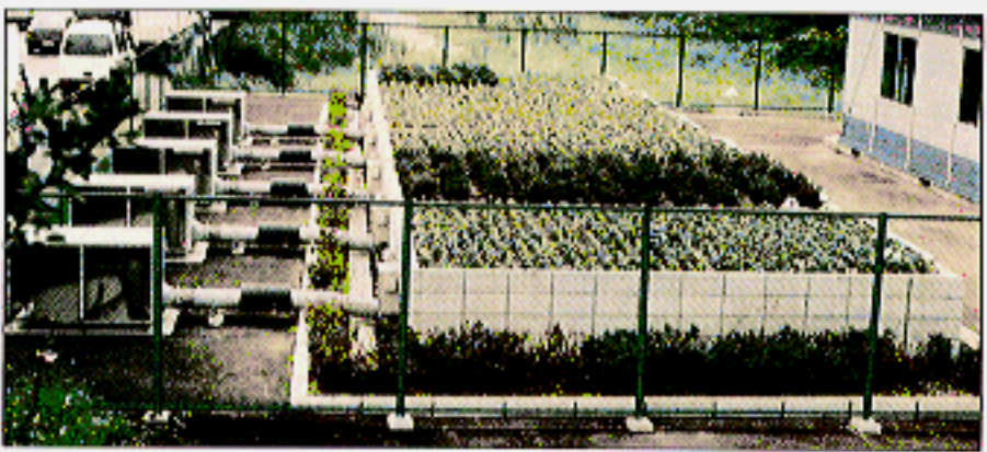
表 土壌を用いた大気浄化システムの大気汚染物質除去性能

また、二酸化チタン等の光触媒を用いて、建物の壁などで窒素酸化物を分解できる新建材を開発する「光触媒によるNOx浄化建材の実用化調査」を実施しています。