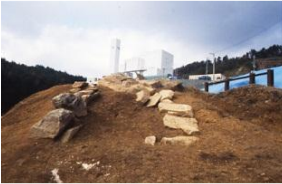
■ 暮坂古墳横穴式石室の羨道部全景（南東から）