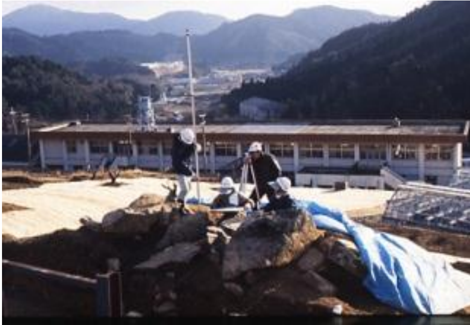
■ 暮坂古墳調査風景（北東から）