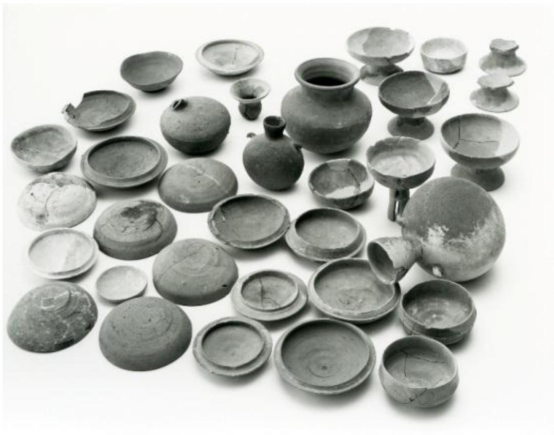
■ 「篠口暮坂古墳群」から採集された土器（大阪府立能勢高等学校所蔵）