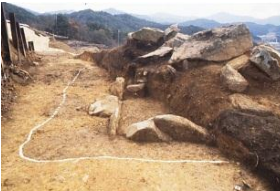
■ 暮坂古墳横穴式石室の玄室部（北西から）