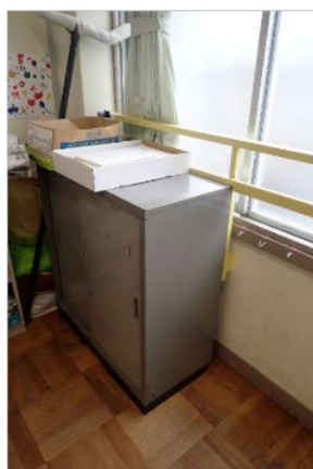
写真1 教室の窓際に 設置された棚

消費者安全調査委員会は、被害の発生又は拡大の防止を図るため、小中学生が被災した事故等のうち、主に学校の施設又は設備が原因で発生したと考えられる事故等について、公立の小中学校を中心に調査を行うこととした（写真1、2は、訪問した学校において確認された、死亡の危険のある設備例）。