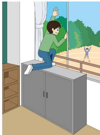
図1 事故のイメージ (棚に登り窓から転落)