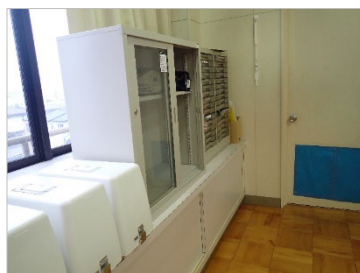
写真2 積み重ねられ 固定されていない棚