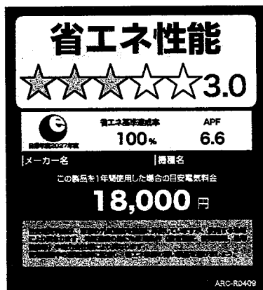
(家庭用エアコンディショナーのイメージ)