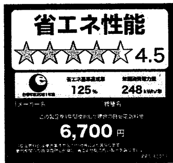
(冷蔵庫のイメージ)