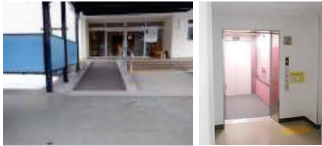
児童生徒の状況に合わせ、スロープを、勾配の小さいものに付け替え 防火上の既存不適格を解消し、エレベーター棟を増築