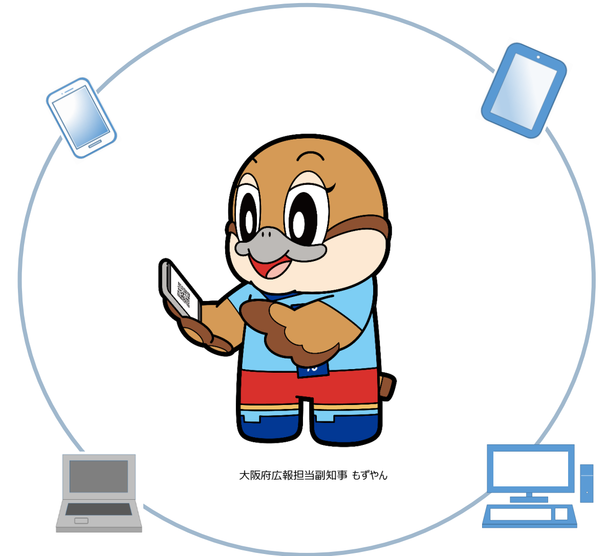
大阪府広報担当副知事 もずやん