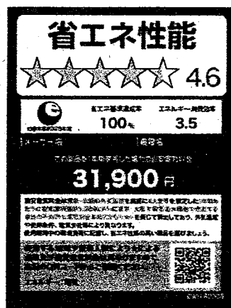
(電気温水機器のイメージ)

※ 照明器具、テレビジョン受信機、家庭用電気冷蔵庫、家庭用電気冷凍庫、温水機器及び電気便座については、2020年11月及び2021年8月に上記様式に変更済。今後、家庭用エアコンディショナーについても上記様式に倣ったものに変更予定。 なお、温水機器以外は、製品のサイズやネット取引等の限られたスペースで使用する場合は右側のミニラベルを活用すること。